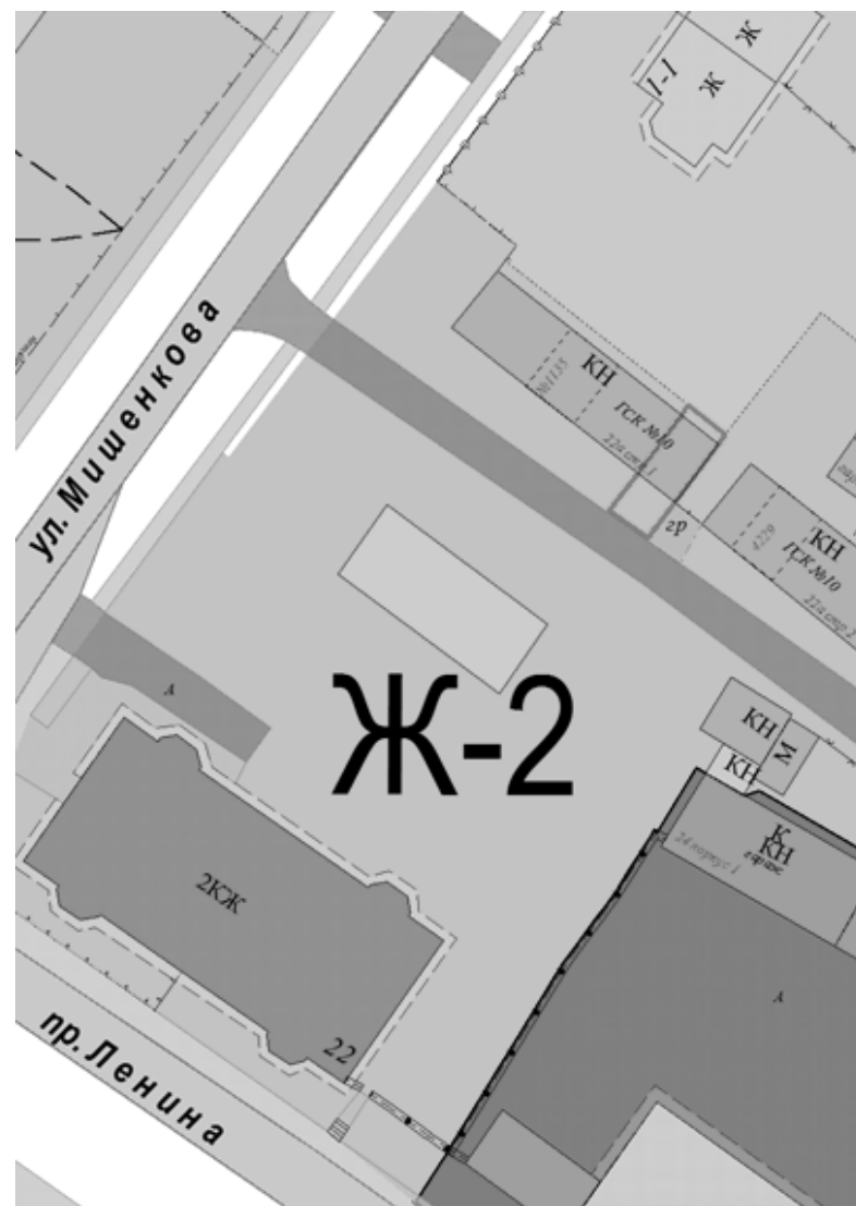
Ж-2 - территориальная зона застройки малоэтажными и среднеэтажными жилыми домами

Земельный участок с кадастровым номером 74:41:0101038:739 по адресу: Российская Федерация, Челябинская область, Озерский городской округ, г. Озерск, проспект Ленина, 22а, строение 1, гараж № 1686