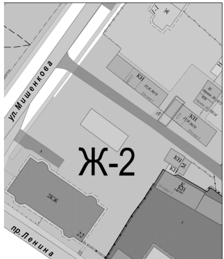
Ж-2 - территориальная зона застройки малоэтажными и среднеэтажными жилыми домами

Земельный участок с кадастровым номером 74:41:0101038:740 по адресу: Российская Федерация, Челябинская область, Озерский городской округ, город Озерск, проспект Ленина, 22а, строение 2, гараж № 1445